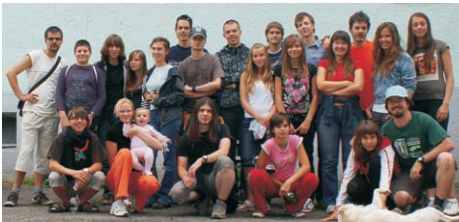
Dorastový a mládežnícky tábor, Kyslinky 08/2009